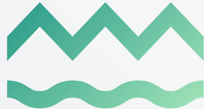
LIIKEMERKKI KÄYTETTÄVÄKSI ERILLÄÄN