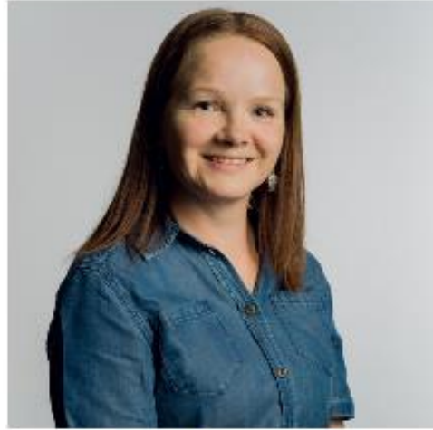
Kansainvälisten asioiden assistentti