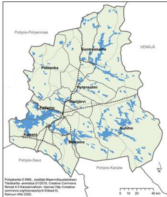
Kuva 2. Kainuun tuulivoimamaakuntakaavan kaava-alue.

Enklaaveja (=hallinnollinen alue tai sen osa, joka on kokonaan tai suurimmaksi osaksi toisen vastaavan hallinnollisen alueen ympäröimä) ei käsitellä maakuntakaavassa maakuntakaavan yleispiirteisestä mittakaavasta (1:250 000) johtuen.