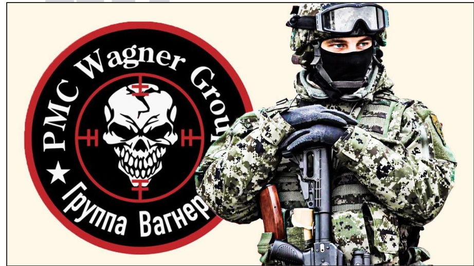
Mahdollisesti tunnetuimman venäläisen palkka-armeijan tunnus ja palkkasotilas