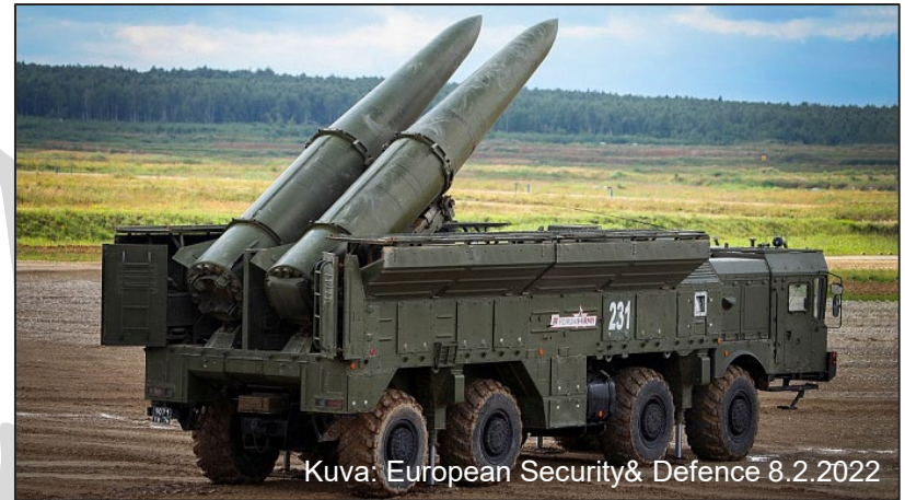
Kuva: European Security & Defence 8.2.2022