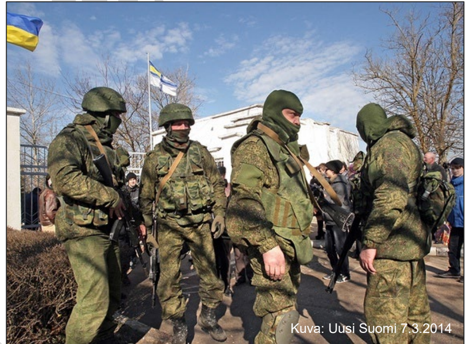
Kuva: Uusi Suomi 7.3.2014

Eräs historian tunnetuimmista erikoisoperaatioista; totta vai tarua?