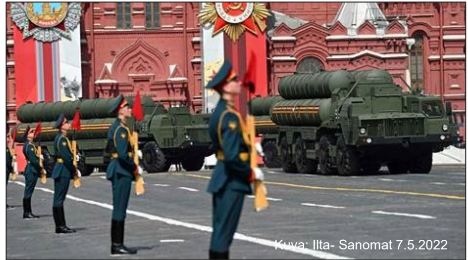
Kuva: Iltta- Sanomat 7.5.2022