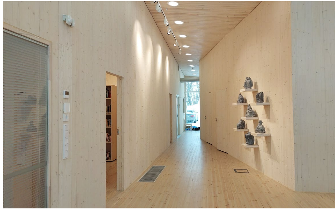
Kuhmon Juminkeon Koppanen-lisäosa.