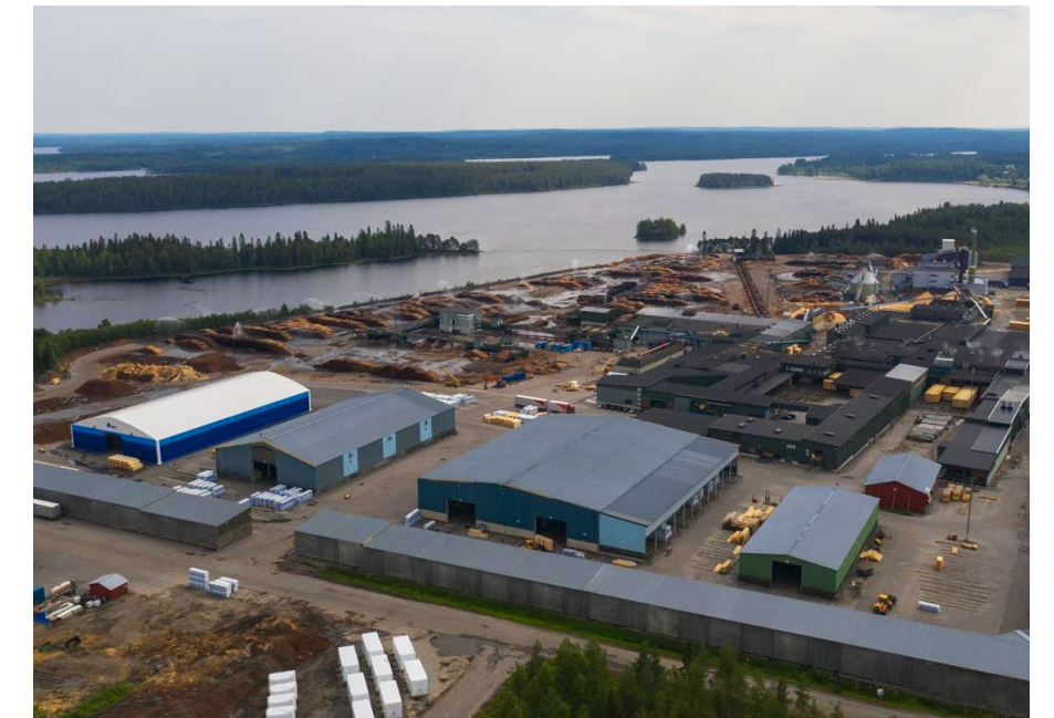
Ilmakuva Kuhmo Oyn sahalta.