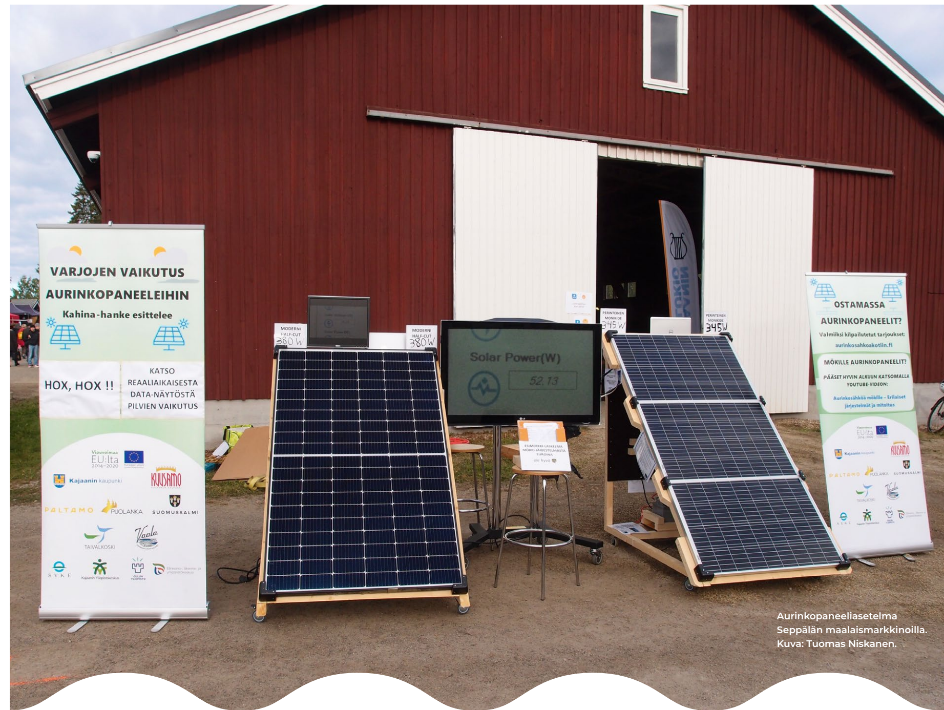
Aurinkopaneeliasetus Seppälän maalaismarkkinoilla.