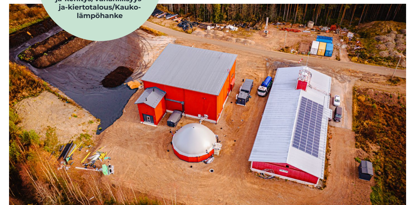
Puolangan biokaasulaitos.