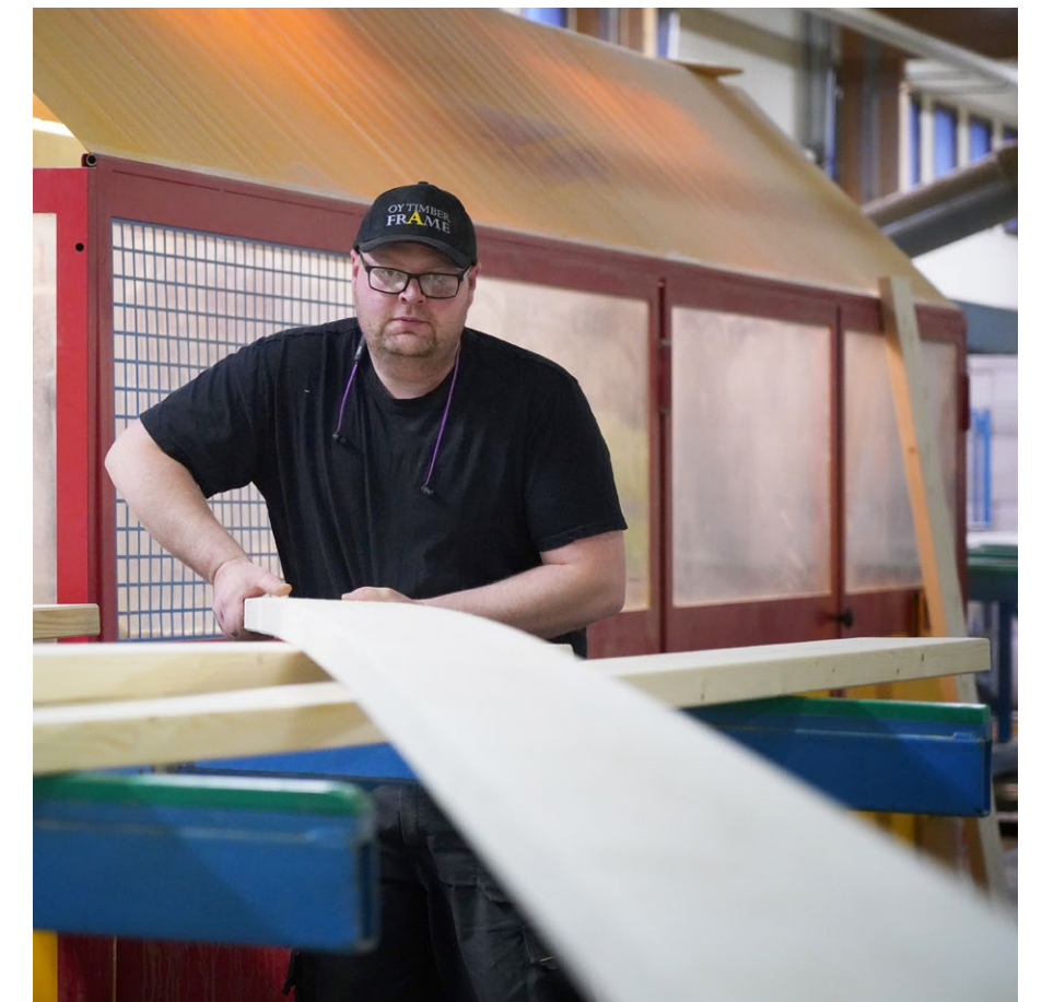
Työntekijä Timber Frame Oyn tiloissa.