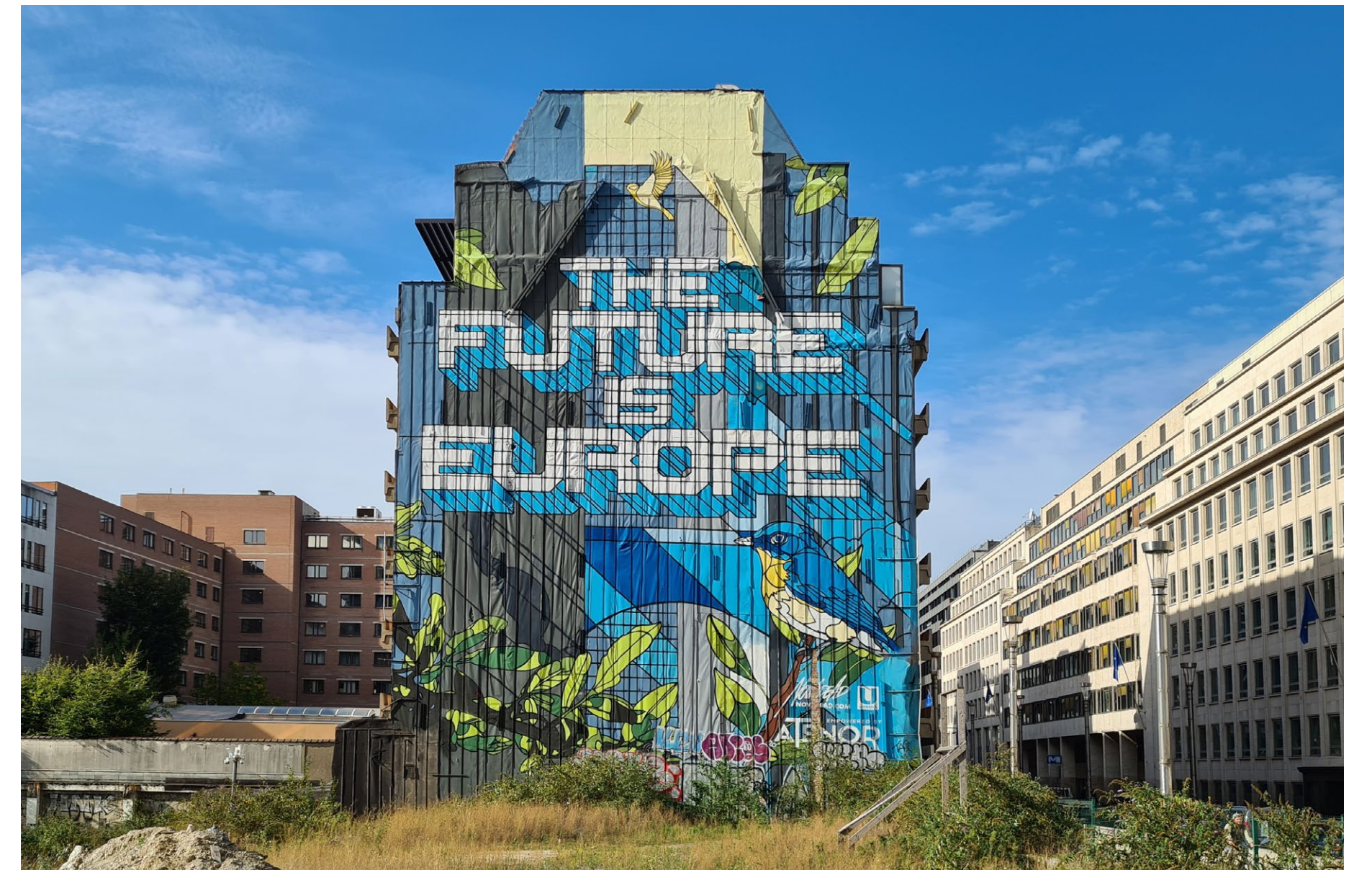
Rakennuksen julkisivu Brysselissä.

Tuomas Niskanen Projektipäällikkö, KAHINA-hanke, Oulun yliopisto, Kajaanin yliopistokeskus