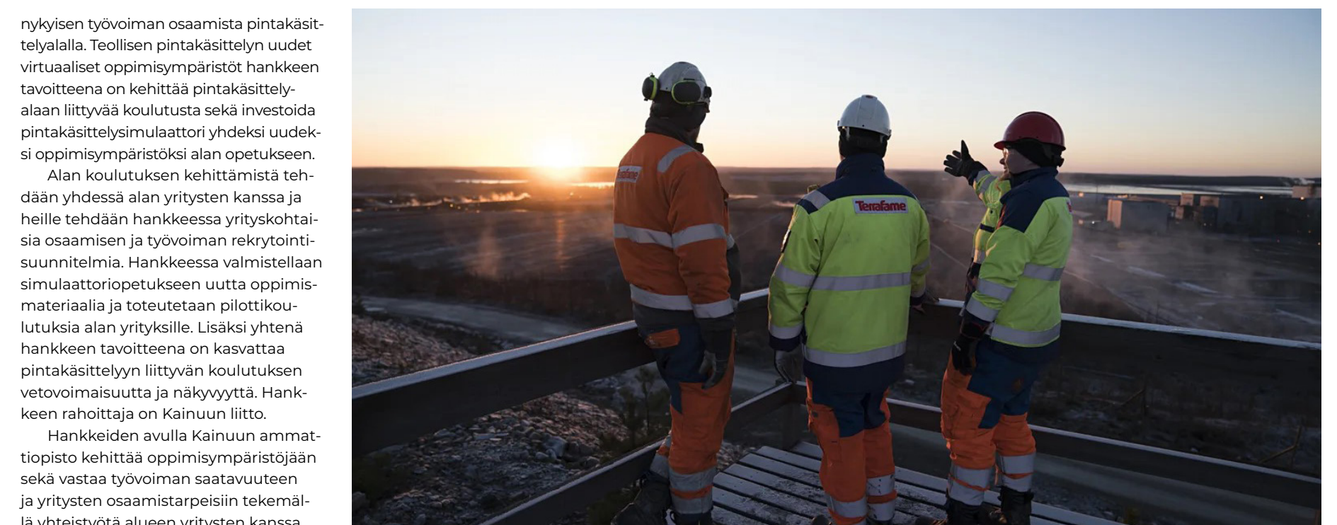
Terrafamen työntekijöitä.

Kainuun ammattiopiston SimSpray maalausimulaattori.