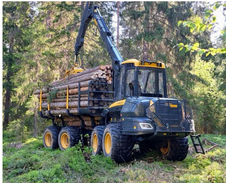
Kainuun ammattiopiston metsäkoneiden ajoharjoitteluympäristö.

Akkukemikaaliyhtiö Terrafame Oy on hyödyntänyt useamman vuoden ajan oppisopimuskoulusta niin uuden henkilöstön rekrytoinnissa kuin myös työsuhteessa olevan henkilöstön osaamisen kehittämiseksi. Terrafame Oy on tarjonnut myös alaa opiskeleville opiskelijoillemme kesätöitä sekä mahdollisuutta kesäajan oppisopimukseen nopeuttamaan opintojen suorittamista.