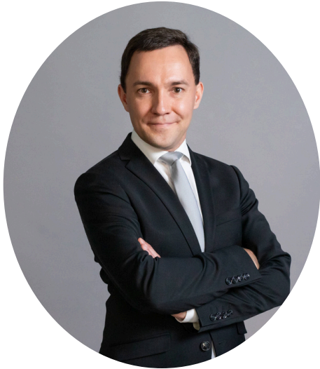
Wille Rydman, elinkeinoministeri