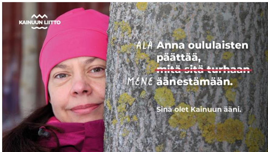
Kuva 2. "Kainuun ääni" – mainoskampanja äänestysaktiivisuuden puolesta

Toimintavuoden 2023 isoimmat panostukset aluemarkkinoinnin saralla olivat äänestysaktiivisuuteen keskittynyt aktivointikampanja sekä uuden maakuntajohtajan rekrytoinnissa avustaminen. Huomioitavia markkinointikampanjoita olivat Kajaanin Hakan yhteistyökumppanina toimiminen heidän vauvabodykampanjassaan sekä osallistuminen Kajaanin ammattikorkeakoulun uusille opiskelijoille suunnatun "fuksiämpäriin" sisältöön. Uusi maakunnan sisäisen markkinoinnin kokeilu oli osallistuminen Kajaanifest -festivaaleille yhdessä halukkaiden kuntien kanssa. Perinteisenä ponnistuksena maakunnallisen mainetyön saralla oli tammikuun matkamessut Helsingissä.